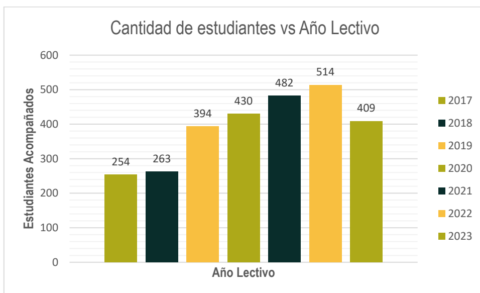
Figura 1. Estudiantes caracterizados vs año lectivo

La Figura 1, representa la cantidad de estudiantes apadrinados en función del tiempo.