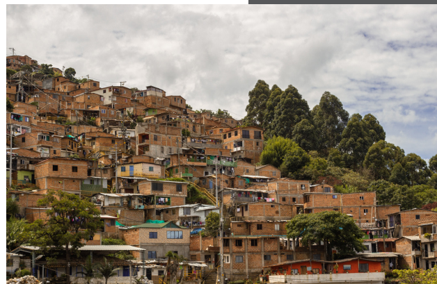
Cortés: Simón MC © 2019

Por su parte, las encuestas pares (2 y 4), se encargaban de analizar el estado del estudiante durante el periodo intersemestral, buscando analizar cambios en la población, movilidad académica, entre otras variables poblacionales