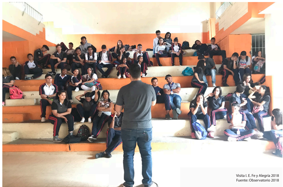
Visita I. E. Fe y Alegría 2018

SE contará este año con la publicación de 4 boletines (incluyendo el presente), que buscan divulgar de forma simple los avances realizados. Se invita a los lectores e interesados a acceder al sitio web del observatorio, en donde podrán encontrarse los recursos divulgativos del año 2018 y próximamente los del actual.